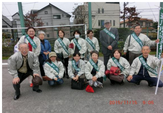
市民まつりパレード

平成 28 年 3 月 14 日 「しろばら」第 80 号発行 編集作業 7 回