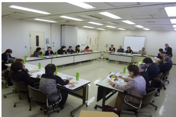
東大和市との意見交換会